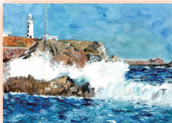
大吠岬灯台 (千葉県)