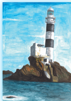
水ノ子島灯台 (大分県)