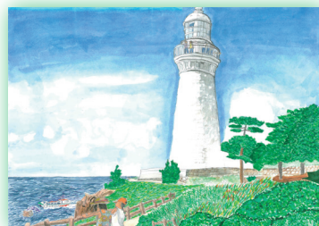
出雲日御碕灯台 (島根県)