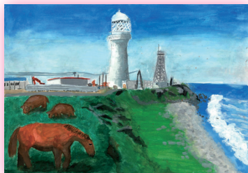
尻屋埼灯台 (青森県)