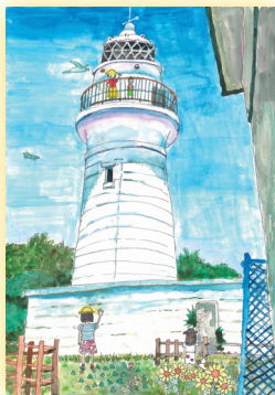
海岬灯台 (和歌山県)