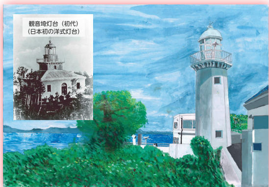
現在の観音埼灯台 (3代目、神奈川県)