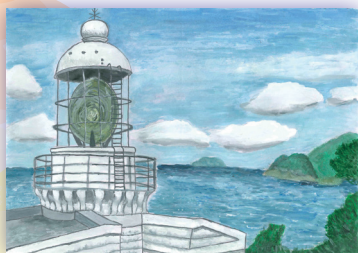
経ヶ岬灯台 (京都府)